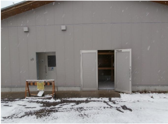
センター倉庫入口 (左は公衆トイレ)