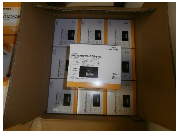
ヨウ化カリウム丸