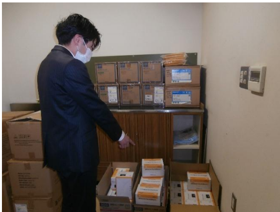
病院（レントゲン室）