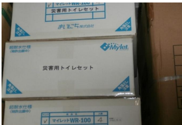
災害用トイレセット