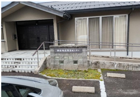
センター外観正面