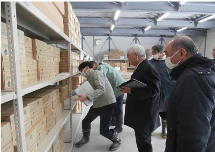
スチール棚に保管の物資