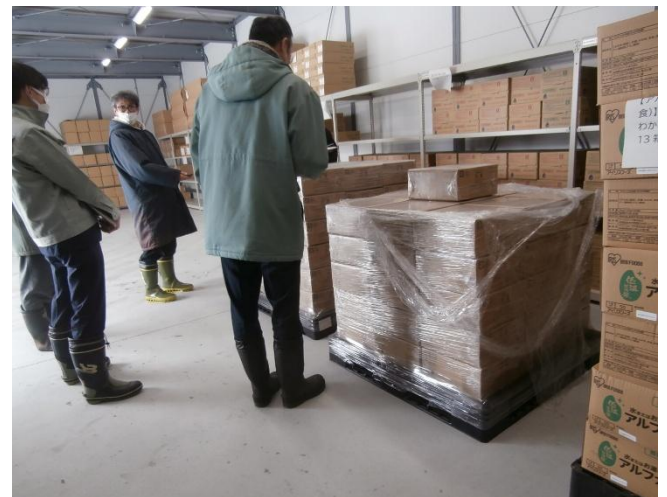
パレットに保管の物資