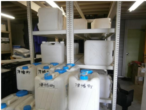
給水用ポリタンク