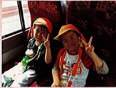
今から行ってきまーす！