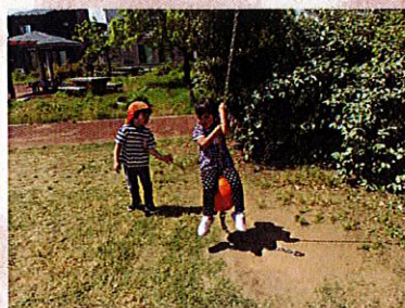
ブランコみたーい！