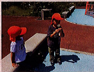
たんぽぽの綿毛見つけた！飛ぶかな～