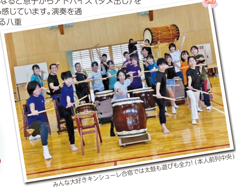
みんな大好きキンシュール合宿では太鼓も遊びも全力!(本人前列中央)