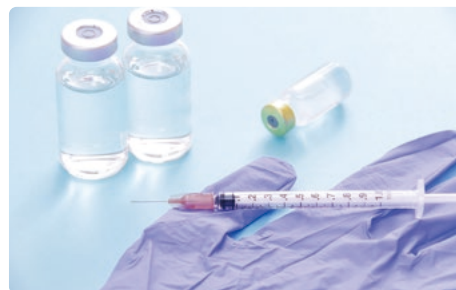
RSウイルスワクチン接種が定期接種に「予防接種の助成」