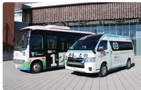
のーと津幡の運行エリア拡大「町営バス運営費」