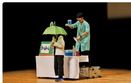
「科学教育の振興」 ※写真は昨年度に開催した科学の祭典