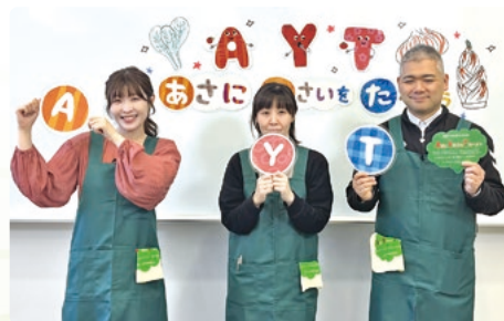
一部の番組は他局への貸出も「チャンネルつばた」