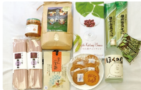
返礼品を豊富に「ふるさと納税の推進」