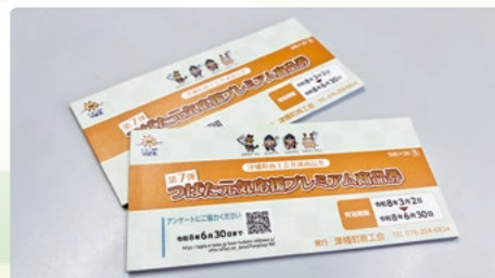
プレミアム率100%で家計を補助「プレミアム商品券」