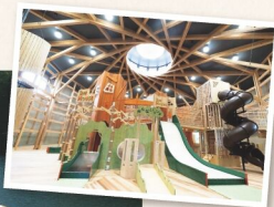
木製の遊具が大人気! 「もりのひみつきち」