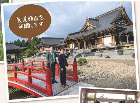
庭園は春には、色とりどりのツツジやボタンの花が見事に咲き誇ります。