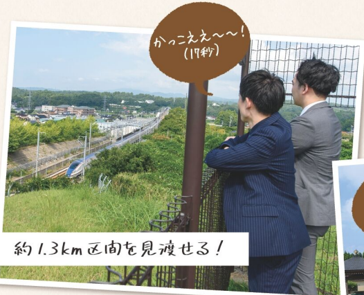
約1.3km区間を見渡せる!