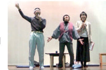
笑いあり、涙あり「津幡爆笑劇団」登場!