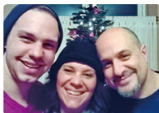
原稿を書いた5日後に帰省。現在は、実家で両親と過ごしています!

日本での暮らしや周囲の人々も大好きなので、しばらく休憩して、1か月後に戻ってきたときには、また気持ちをリセットしてがんばりたいと思います。