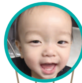
かける 田島 翔琉くん (横浜) どんな顔も可愛くて大好きカケルのお陰で幸せい〜つばい有難う♡