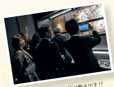
最新技術で、展示物が動き出す！

あけましておめでとうござい ます。 町民の皆様には、健やかに2 017年の新春をお迎えのこと と心からお慶びを申し上げます。