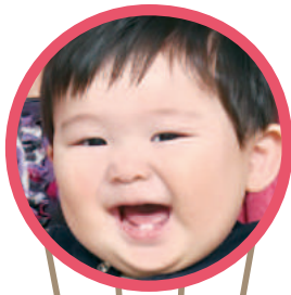
じょうじ 丸茂 文二くん (緑が丘) じょうずにまんまバク! うまい、うまいとじまんげな笑顔です♡