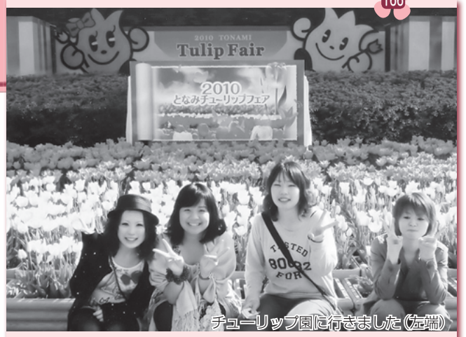
チューリップ園に行きました(左端)