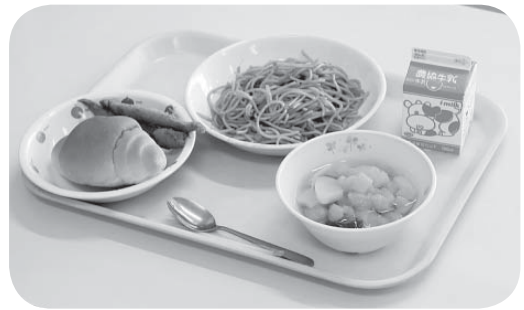
◀食育として実施される給食

文部科学省より教職員に負担をかけない給食費の徴収方法について指針を示すなど、公会計の推進についての通知があった。平成28年の調査では、公会計化をしている自治体は4割となっている。当町では、学校現場の状況や他自治体の状況も参考にし、検討に向けた準備を進める。