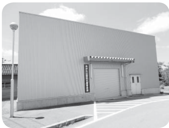
▲あがた公園防災備蓄倉庫

大型地震や台風、豪雨災害はいつ襲ってくるかわからない。新型コロナウイルスでは、複合災害を想定した準備が必要である。避難所利用計画の見直しやスペースの確保、感染症対策用に物資（避難所に必要なパーテーションやマスク、消毒液、ティッシュ、ダンボールベッドなど）の備蓄が必要ではないか。