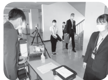
サーモグラフィーによる検温 (6月会議)