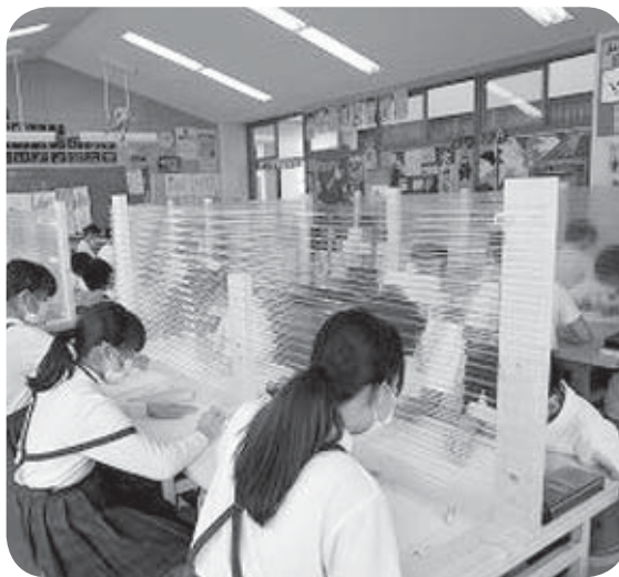
▲コロナ対策を施した図工の授業 (条南小学校)