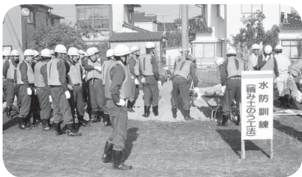
▲豪雨に備えた訓練の様子