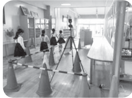
▶スピーディーに体温チェック (津幡小学校)

6月会議で提出された案件は、各常任委員会や分科会で審議し、多くの質疑がありました。その中の主なものを紹介します。