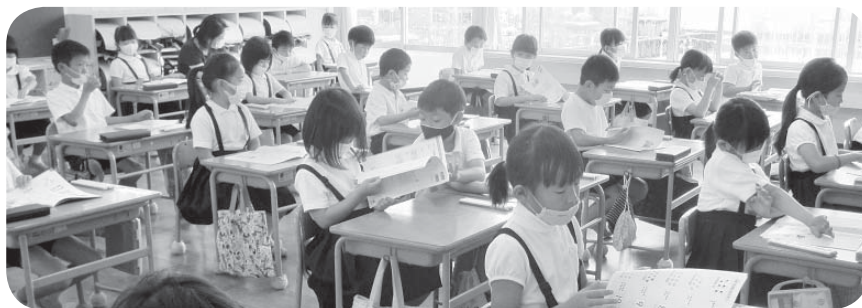
▲学校再開！みんなと会えてよかったね（中条小学校）