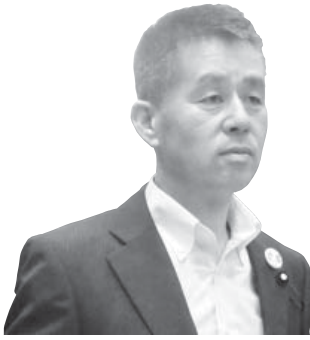
こま ちの り 実 議員 小町 実 議員

町福祉センターは、子どもから高齢者の各種団体がサークル活動などで利用する。現在は改修工事も進んでおり、変更や追加工事が難しいかもしれないが、新型コロナウイルス感染症対策として、3密回避の取り組みが必要であり、換気方法などの対策をすべきではないか。