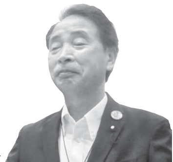
ひろまさ 博 議員 まさひろ 博 議員 したひろ 博 議員 みちひろ 博 議員