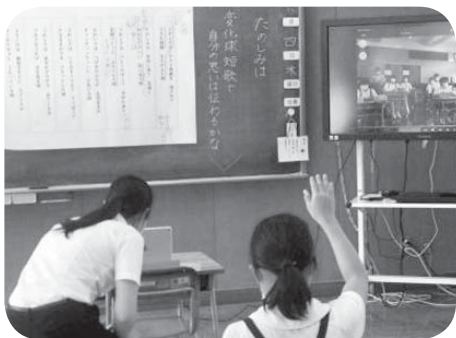
▲複式学級オンライン授業 (刈安小学校・笠野小学校)

児童生徒への1人1台パソコン整備は、遅くとも令和3年1月末を予定している。また、教員への研修会などは、授業への影響が出ないよう工夫し、負担も軽減しながら開催する。2月中にはオンライン学習が可能となる予定である。