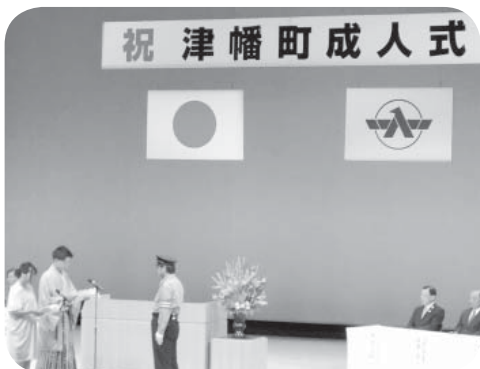
▲成人式は人生の大きな節目