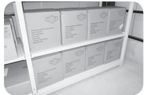
備蓄されているマスク