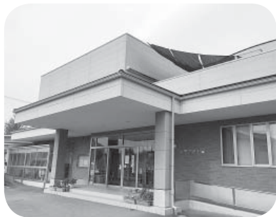
▲町内すべての園で自粛解除 (住吉こども園)

休園時における代替措置は、子育て援助活動支援事業を活用していただきたい。施設長間の会議は、町内の施設が一体となって強力に感染症対策を推進することや、児童福祉施設間の連携策を検討する上で、非常に有効な手段であると考えている。今後、必要に応じて会議を開催したい。