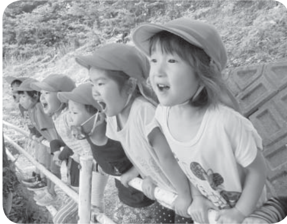
▲子どもたちを応援(太白台保育園)

5月18日に5月会議を開催し、一 般会計補正予算と条例改正の議案3 件、承認12件が提出された。議案は、 各常任委員会審議を経て全議案を可 決した。さらに、議員報酬の特例に 関する追加議会議案1件を可決した。