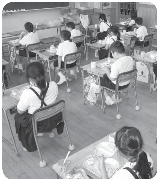
▲みんなで食べるとおいしいね (津幡小学校)