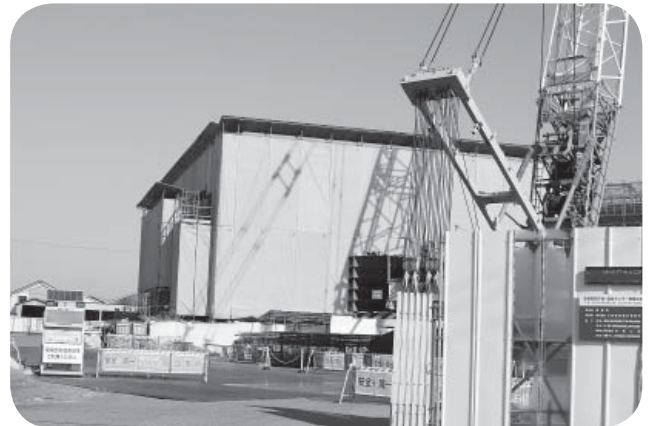
▲利用しやすくなる福祉センター