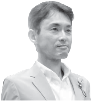
竹内 竜也 議員