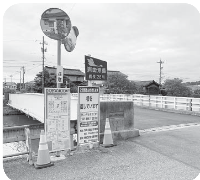
▲これで安全 (浦能瀬橋)

補助金額の決定により、別所橋・東荒屋橋・閑野橋・萩野橋・大谷内橋・岩橋・浦能瀬橋の補修事業費を追加する。