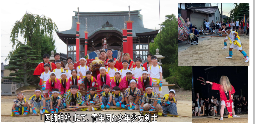
「医師神社」にて、青年団と少年少女剣士